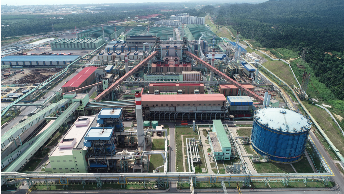
图为入园企业联合钢铁（大马）集团公司厂区

了单月钢产销量超过 30 万吨，顺利达到设计产能，给当地创造 3500 个直接就业岗位，企业既实现了盈利，促进了当地的经济社会发展。