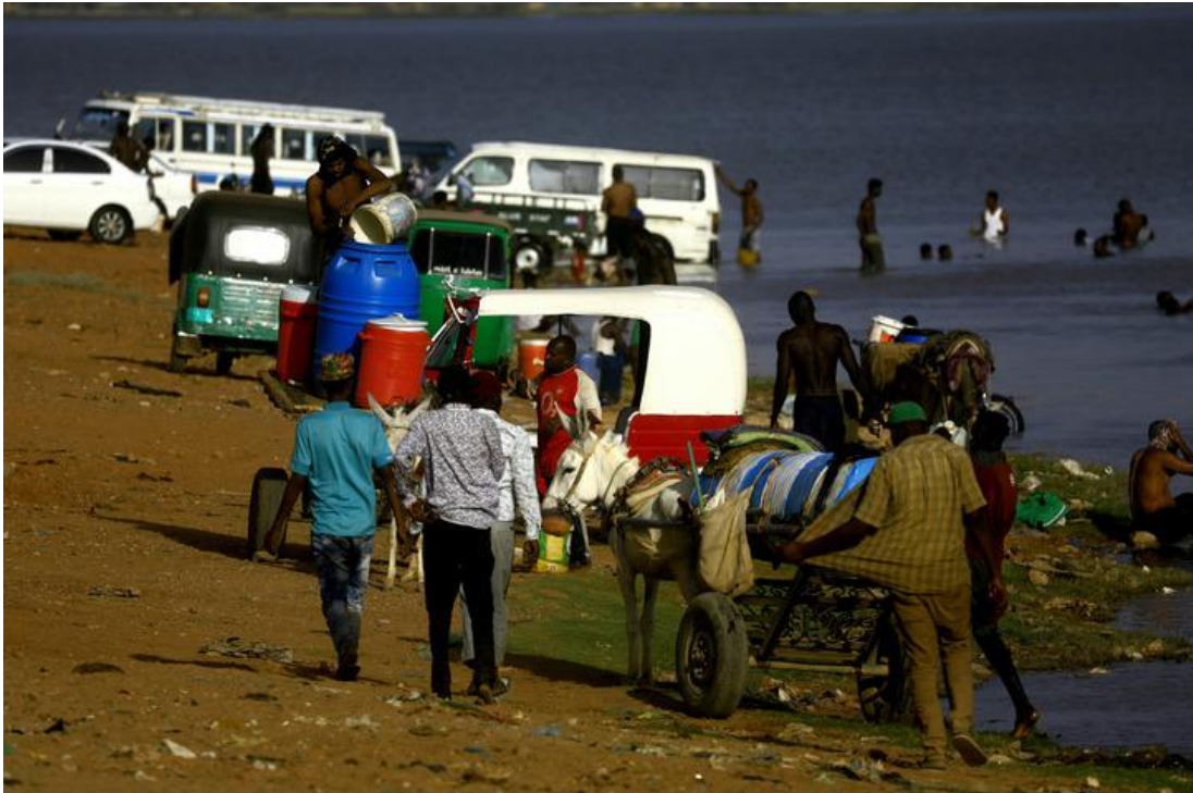
图为4月17日，由于武装冲突导致停水，苏丹喀土穆市民到尼罗河打水 局势短期恐难企稳 政治进程蒙阴影

冲突发生后，中国驻苏丹大使馆迅速发布安全警告，要求国民做好自身防护、严格避免外出，并再次公布领事保护电话。